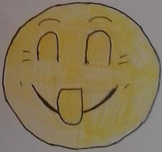
DIYERTIDO & Maso!