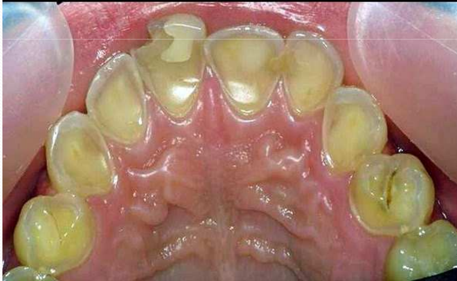
Consecuencias de la anorexia y la bulimia en la cavidad oral